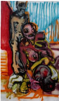
Grosse Salome III , 2020 170x100cm, Mischtechnik auf Leinwand