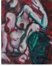
Kleine Susanna II , 2020 50x40cm, Mischtechnik auf Leinwand