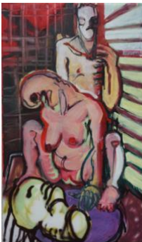
Grosse Salome I , 2020 170x100cm, Mischtechnik auf Leinwand