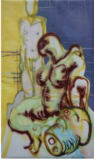
Grosse Salome II , 2020 170x100cm, Mischtechnik auf Leinwand