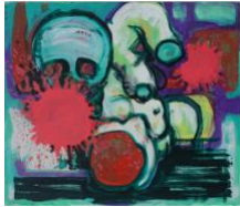
Torso II , 2020 60x70cm, Mischtechnik auf Leinwand