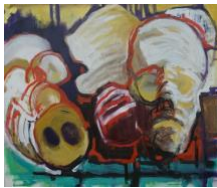
Stilleben II , 2020 60x70cm, Mischtechnik auf Leinwand