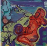
Torso , 2020 60x60cm, Mischtechnik auf Leinwand