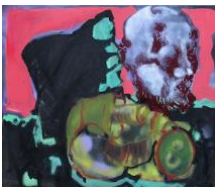
Stilleben I , 2020 60x70cm, Mischtechnik auf Leinwand