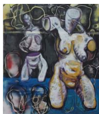
Grosse Susanna II , 2019 140x110cm, Mischtechnik auf Leinwand

Druckgrafik: Bagatelle I-V , Radierung in einmaligem Plattenzustand, CHF 220.- pro Blatt