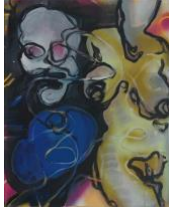
Kleine Susanna I , 2020 50x40cm, Mischtechnik auf Leinwand