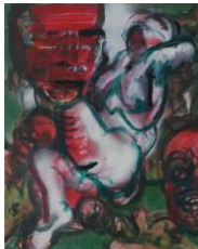
Kleine Susanna III , 2020 50x40cm, Mischtechnik auf Leinwand