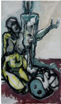
Grosse Salome IV , 2020 170x100cm, Mischtechnik auf Leinwand