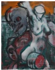
Kleiner Torso I , 2020 50x40cm, Mischtechnik auf Leinwand