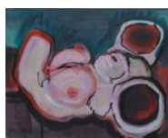
Kleiner Torso IV , 2020 40x50cm, Mischtechnik auf Leinwand