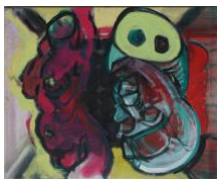
Kleiner Torso V , 2020 40x50cm, Mischtechnik auf Leinwand