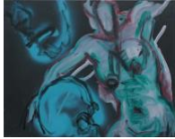
Kleine Susanna V , 2020 40x50cm, Mischtechnik auf Leinwand