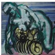
Salome II , 2020 50x50cm, Mischtechnik auf Leinwand