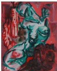
Kleiner Torso II , 2020 50x40cm, Mischtechnik auf Leinwand