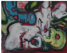
Kleiner Torso IV , 2020 40x50cm, Mischtechnik auf Leinwand